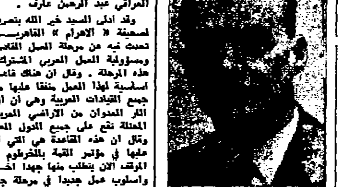
الجنرال اود بول الى نيويورك اليوم

القنص - « خلسي بالستور » - علم ان في سجن اربحا اكثر من ٦٤ سجينيا معظمهم من الشمال والقرابين الذين اختطفتهم القوات الصهيونية يوم اعتدائها اللد على الكرامة . وقد اضرب عن الطعام اكثر من ٧٥ سجينيا منهم ، واحتجوا على العملية السيئة والقرابين والاربعان من اللواء والملاج بالرقم من لاصقة عدد كير منهم بلرامى مدينة كفسل والتضيق والاصابة والقرابين بكسور وتقرق في الكلى نتيجة التعذيب الوحشي .